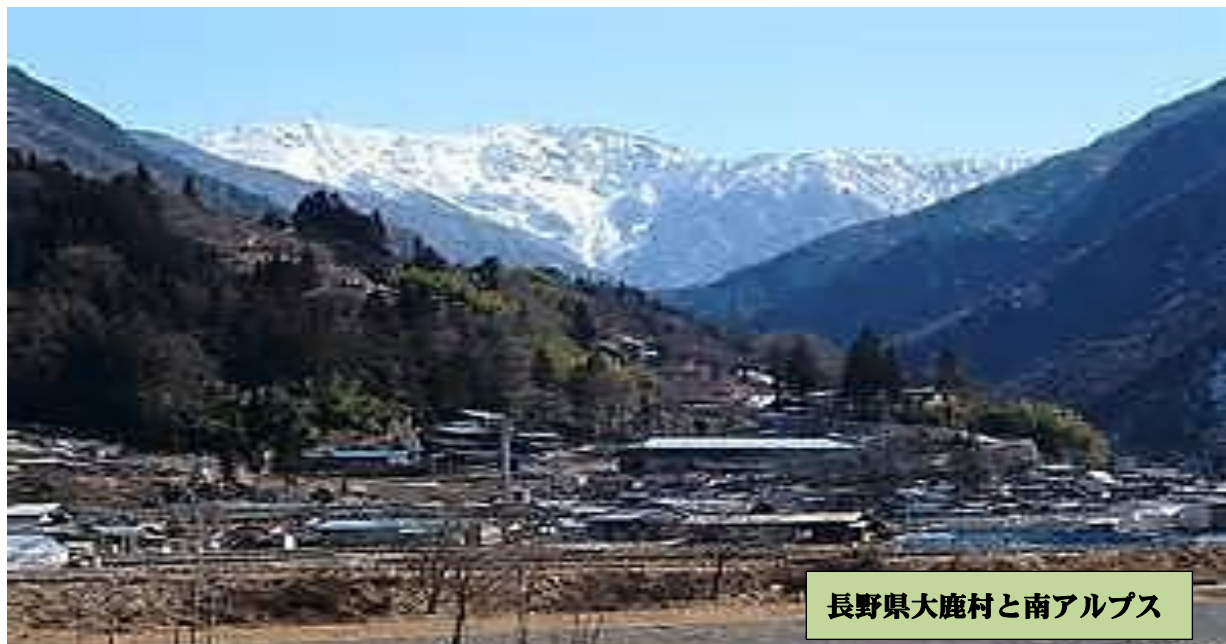
長野県大鹿村と南アルプス